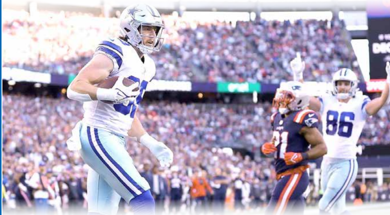
Dallas, saca triunfo ante Patriots en tiempo extra